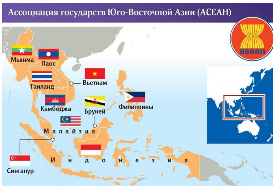
Рис. 1. Государства-члены АСЕАН