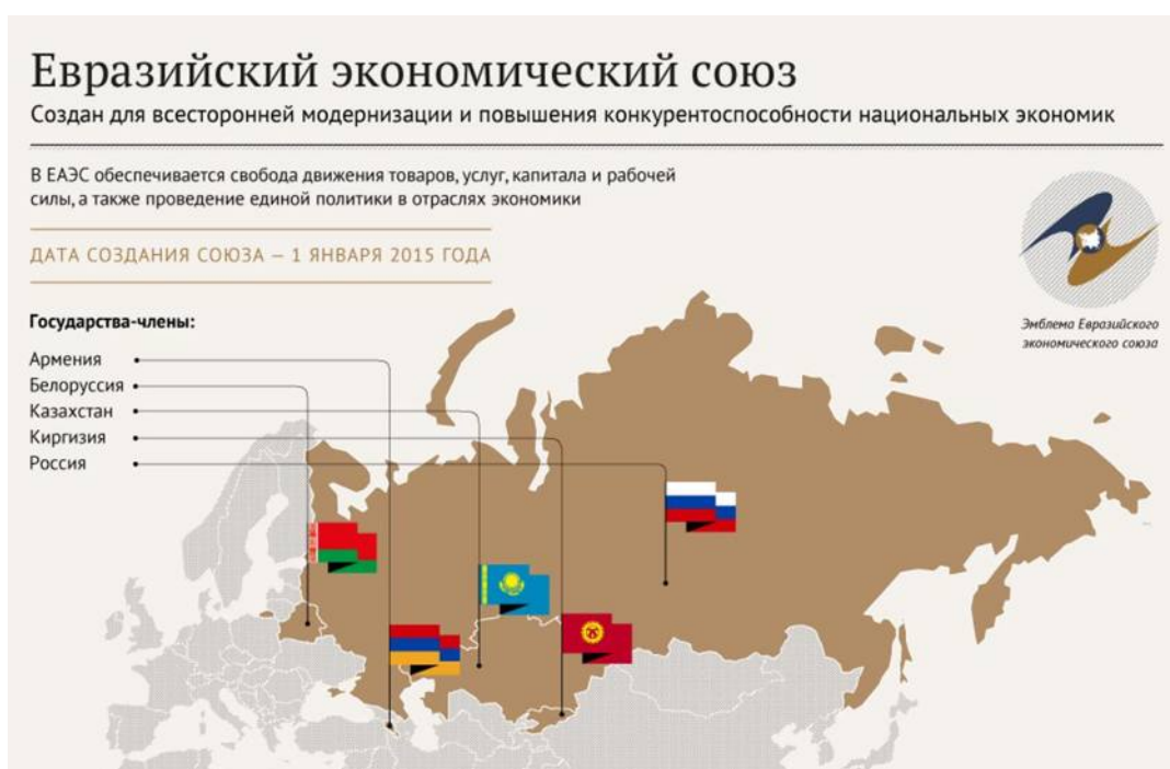
Рис. 2. Государства-члены ЕАЭС