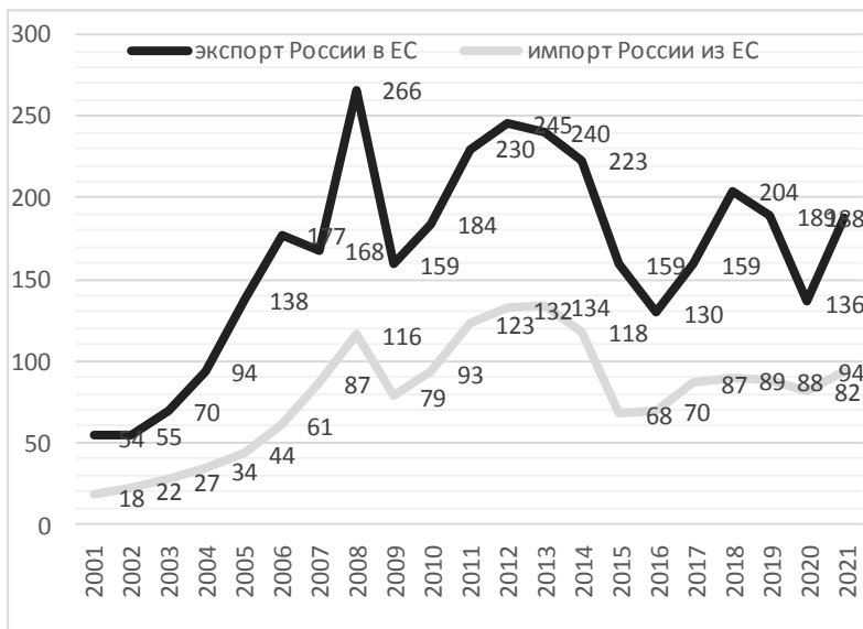
Рисунок 2. Динамика внешней торговли России с ЕС (27), 2001-2021 гг., млрд долларов

Источник: составлено автором на основе данных Trade Map –Trade statistics for international business development. Available at: https://trademap.org/ (accessed 11.03.2022).